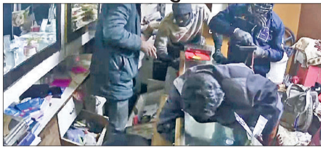
बहादुरगढ़। सीसीटीवी में वारदात को अंजाम देते दिखाई दे रहे चोर।