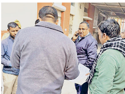
बहादुरगढ़। प्रॉपर्टी टैक्स रिकवरी को लेकर बिल्डिंग सील करने पहुंचे नप अधिकारी।