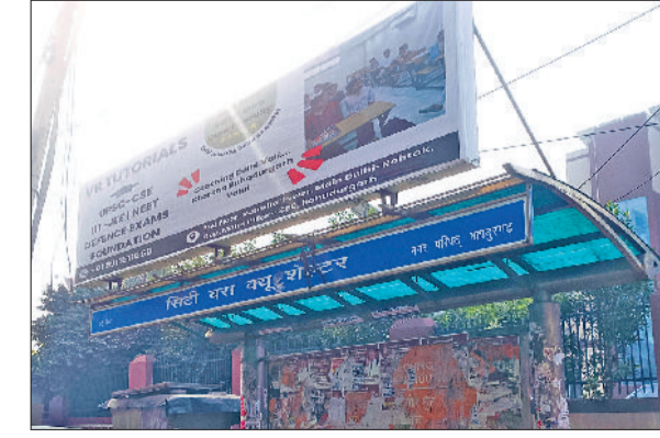
बहादुरगढ़। सफेद हाथी बना रेट हाउस के बाहर स्थित सिटी बस क्यू शेल्टर।

शहर में सिटी बस सर्विस की दरकार है। पिछले कुछ वर्षों में दो से तीन बार यह सर्विस शुरू हुई है, लेकिन बेहतर रिसांस न मिलने और स्टाफ के अभाव में यह सेवा बंद हो गई। नजदीकी यात्रा के लिए फिलहाल लोग श्री व्हीलर और ई रिक्शाओं पर ही यात्री निर्भर हैं। अखिरी बार जुलाई 2024 में यह सर्विस शुरू हुई थी। तब नए से पुराने अट्रू के लिए पांच रुपये और जाखोदा तक दस रुपये किराया निर्धारित किया गया। यह बस सर्विस शुरू हुई तो कामगारों को बेहद लाभ हुआ लेकिन कुछ दिन के बाद सड़कों पर सिटी बस नजर नहीं आई। कुछ रोडवेज कर्मियों की मानें तो लोगों की डिमांड तो थी लेकिन सिटी बस सर्विस को उतना रिसांस