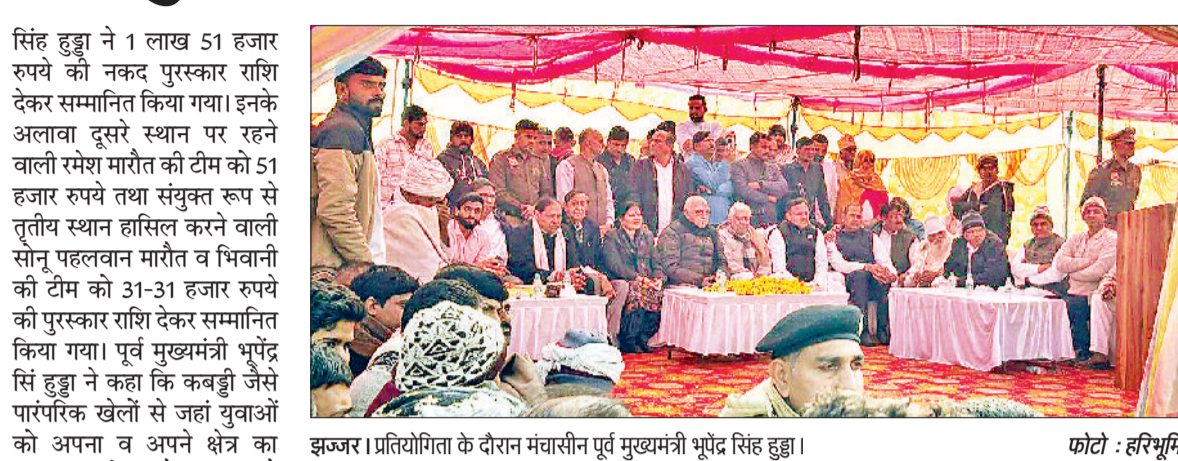
झज्जर। प्रतियोगिता के दौरान मंचासीन पूर्व मुख्यमंत्री भूपेंद्र सिंह हुड्डा।

विजेता टीम को 1 लाख 51 हजार और उपविजेता को 51 हजार रुपये की नकद पुरस्कार राशि देकर सम्मानित किया