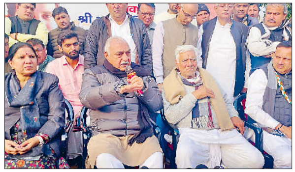
झज्जर। पत्रकार वार्ता को संबोधित करते हुए पूर्व मुख्यमंत्री भूपेंद्र सिंह हुड्डा।