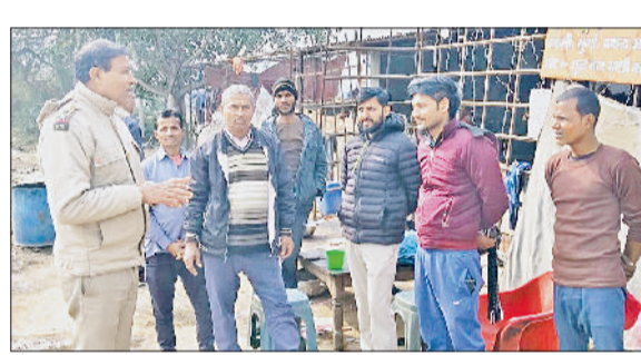
बहादुरगढ़। ग्रामीणों को जागरूक करती पुलिस।